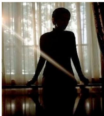
Indagine Cenispes: sono raddoppiati nel primo semestre